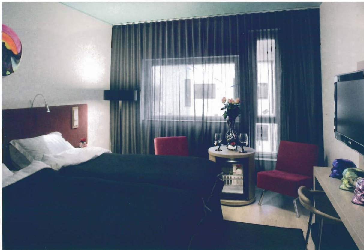
Hållbara och specifika kostnadseffektiva lösningar har kombinerats med design och formgivning, liksom med logistik och driftsförutsättningar av hotellet.

Tanken som ligger bakom allt har gjort Kosta Boda Art Hotel till vad det är idag – ett hotell vars motsvarighet saknas i världen. ■